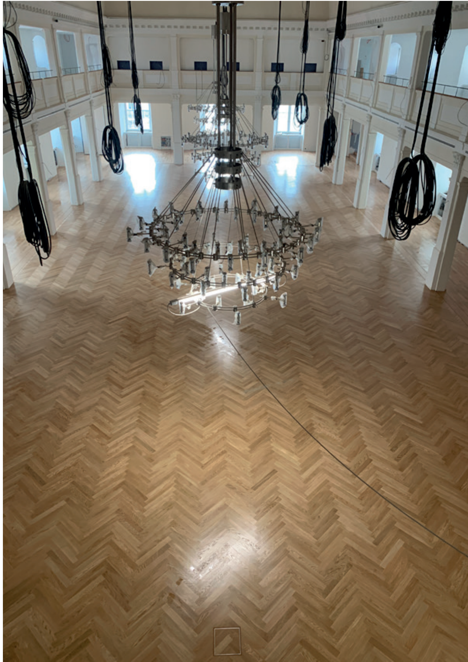
1. Großer Saal