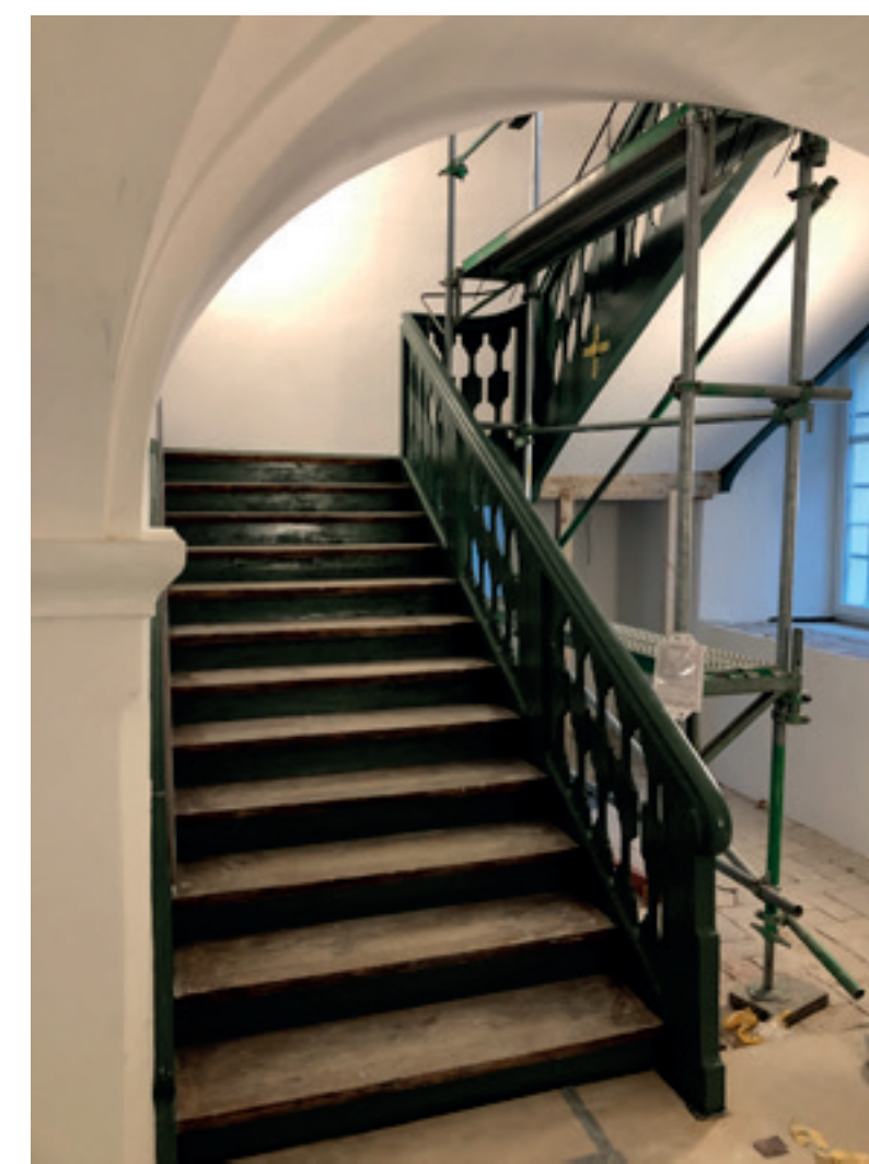
5. Treppenanlagen Nord + Ost