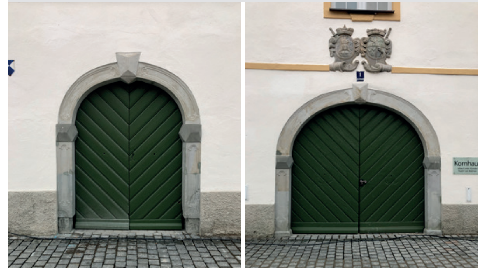
3. Sanierung Bestandstore