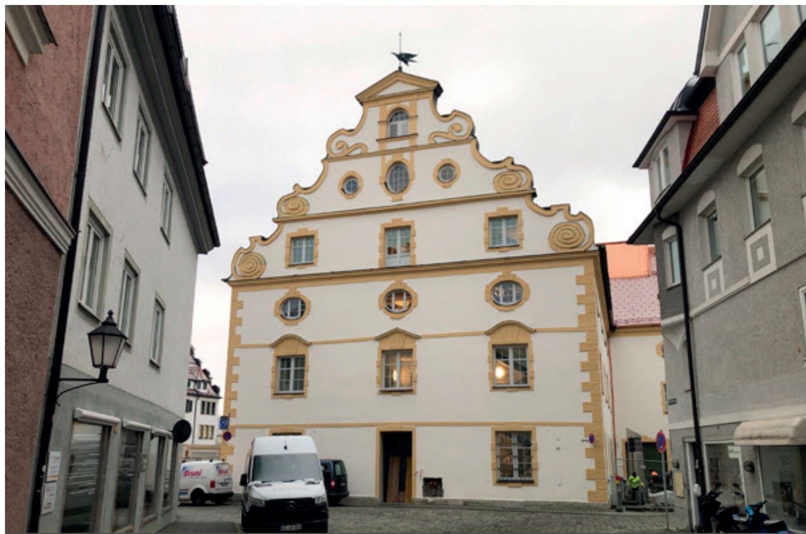
3. Ansicht Nord