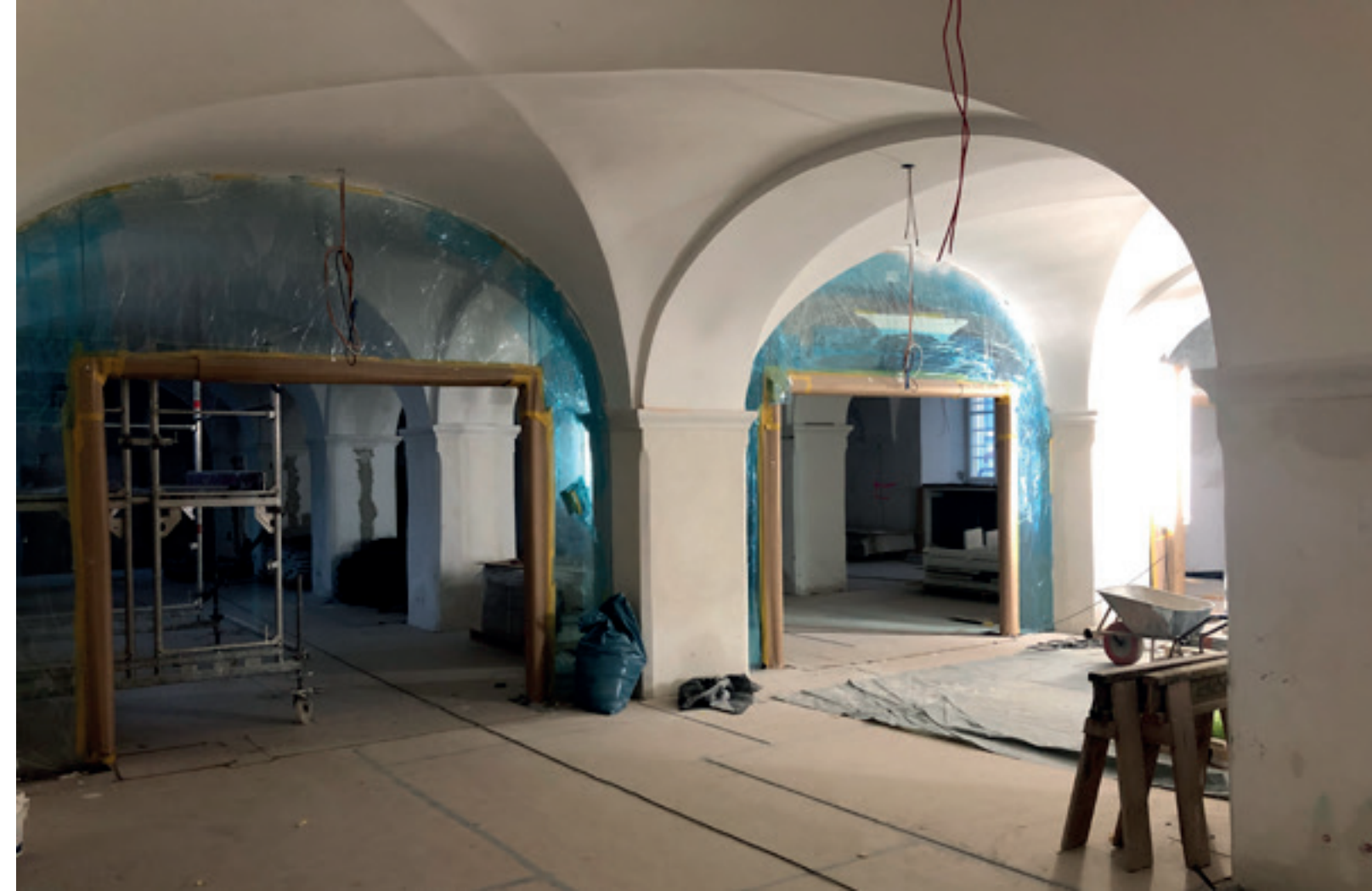
2. Tür- und Glaselemente