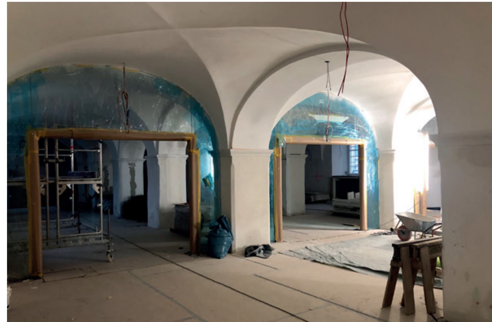
2. Tür- und Glaselemente