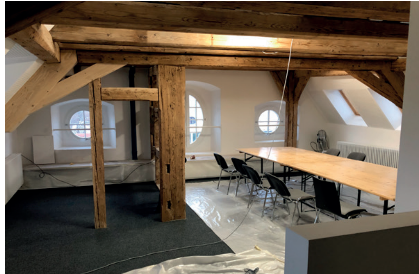
2. Ausbaustand Besprecher Ostflügel