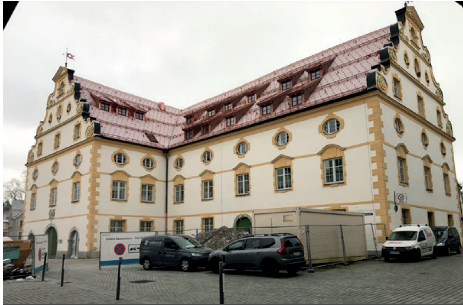
1. Ansicht Ost