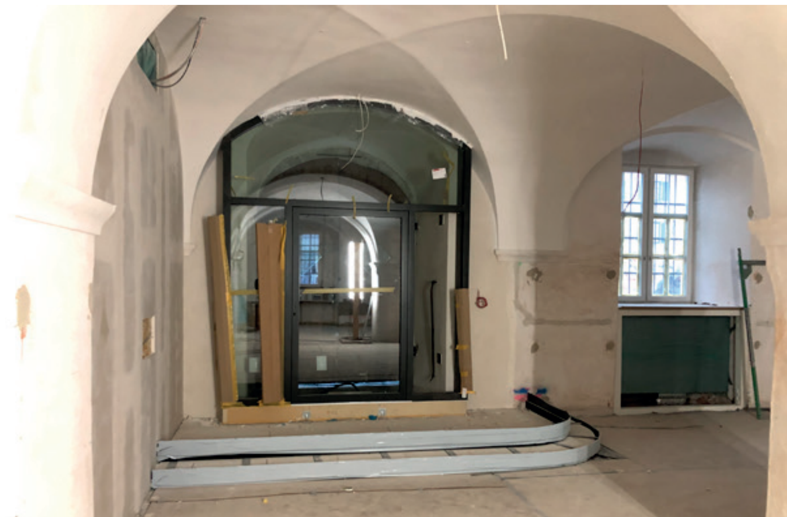
3. Tür- und Glaselemente