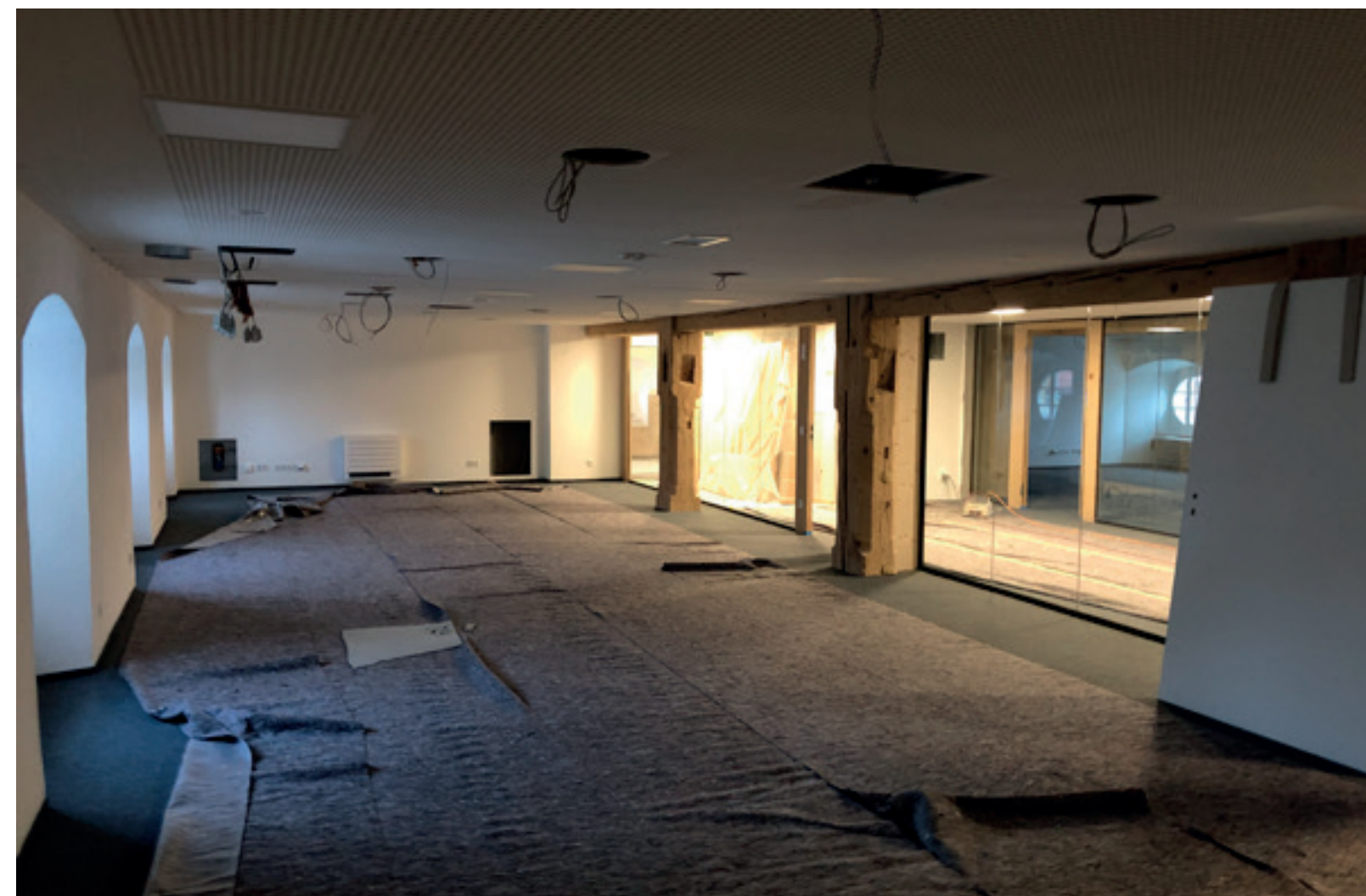
4. Ausbaustand Seminarbereich