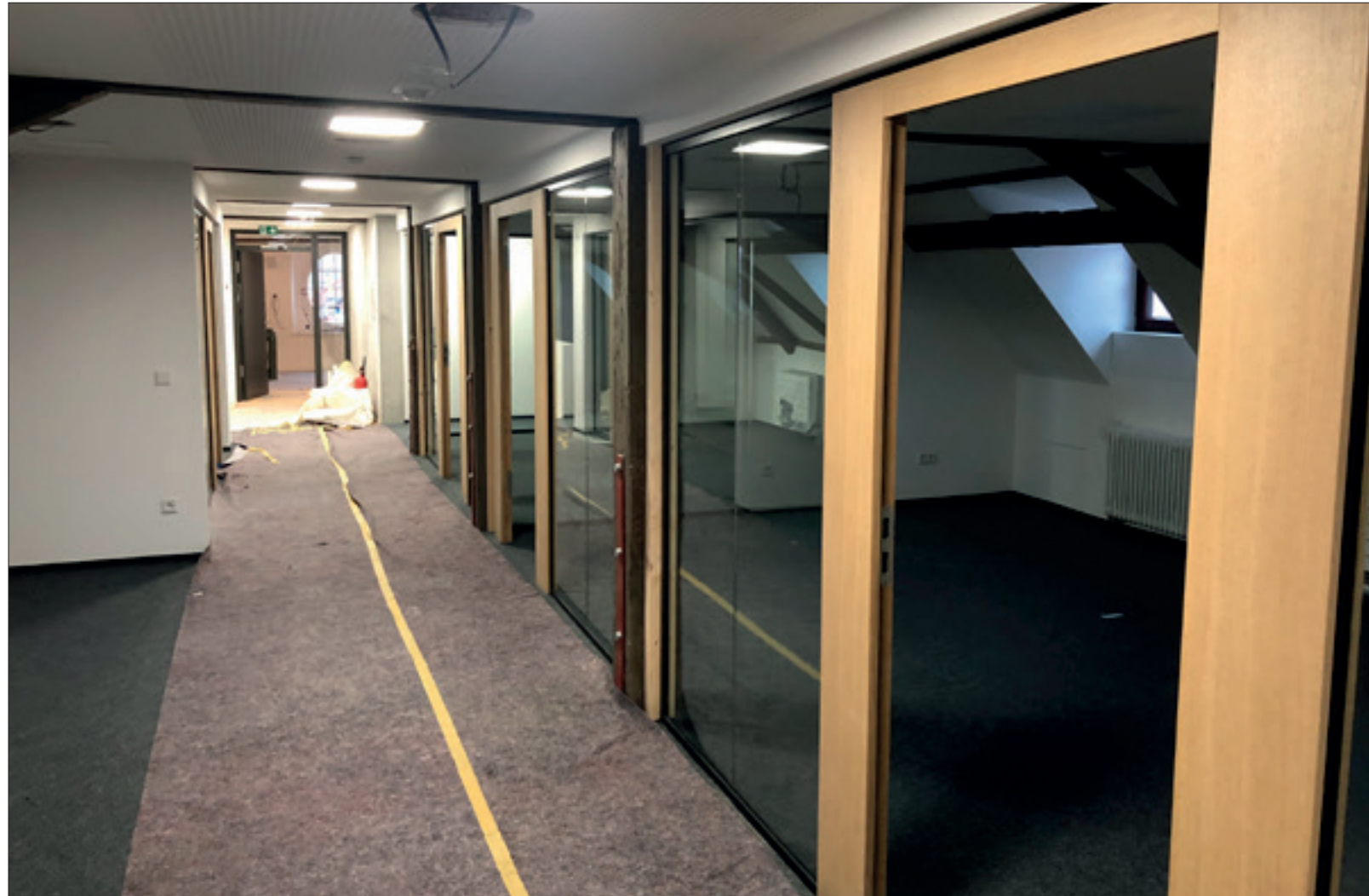
1. Ausbaustand Büroräume DG2