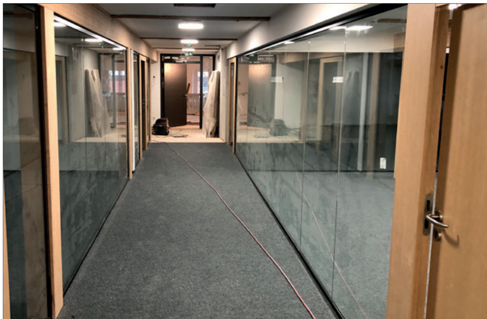
3. Ausbaustand Büroräume DG1