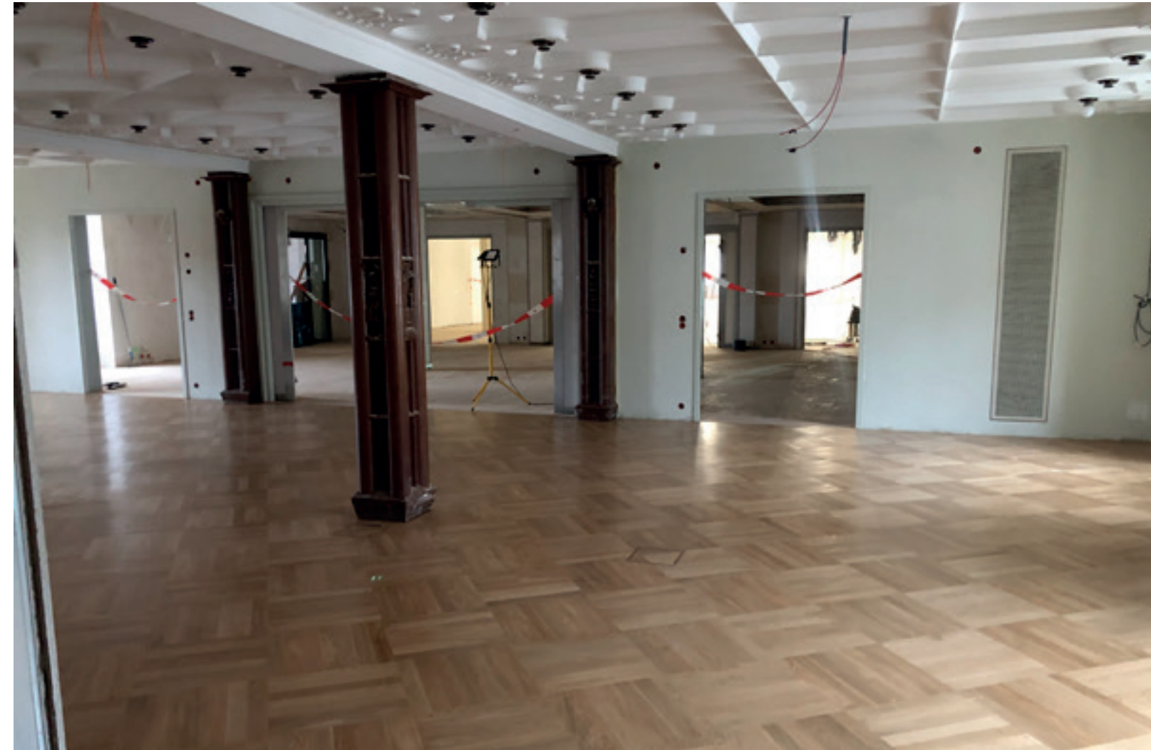
2. Kleiner Saal