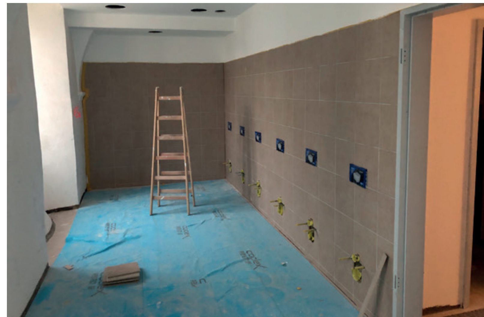
4. WC-Anlagen Veranstaltungsbereich