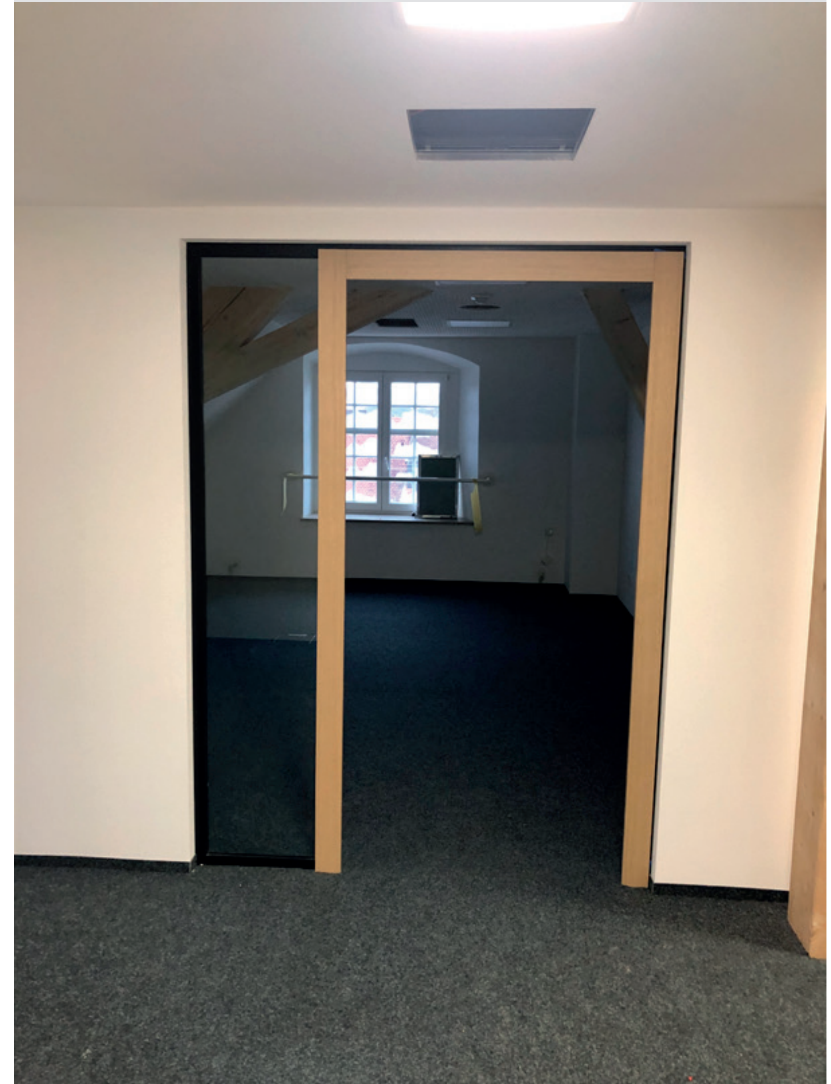
5. Ausbaustand Büro DG1