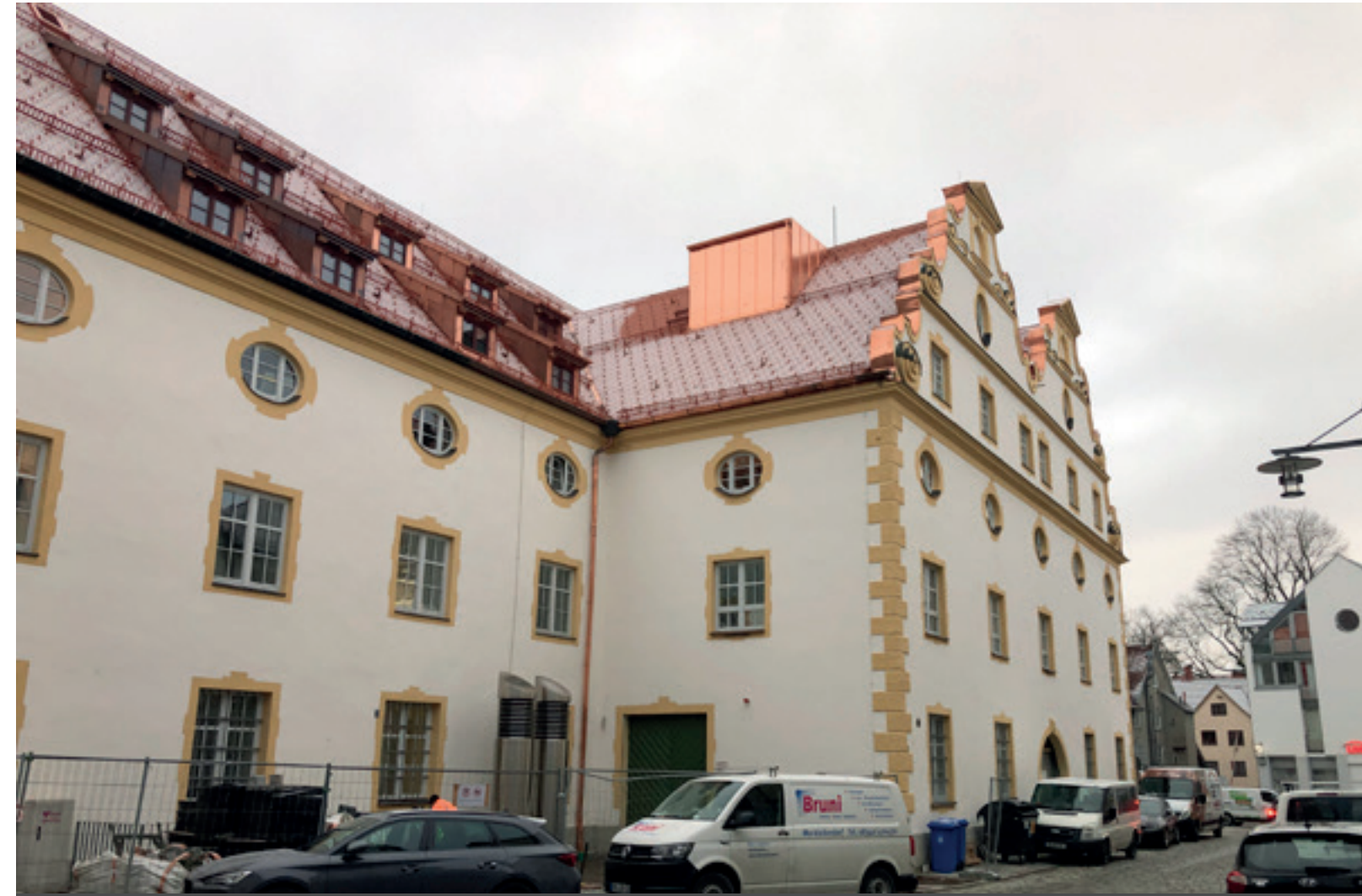
2. Ansicht West