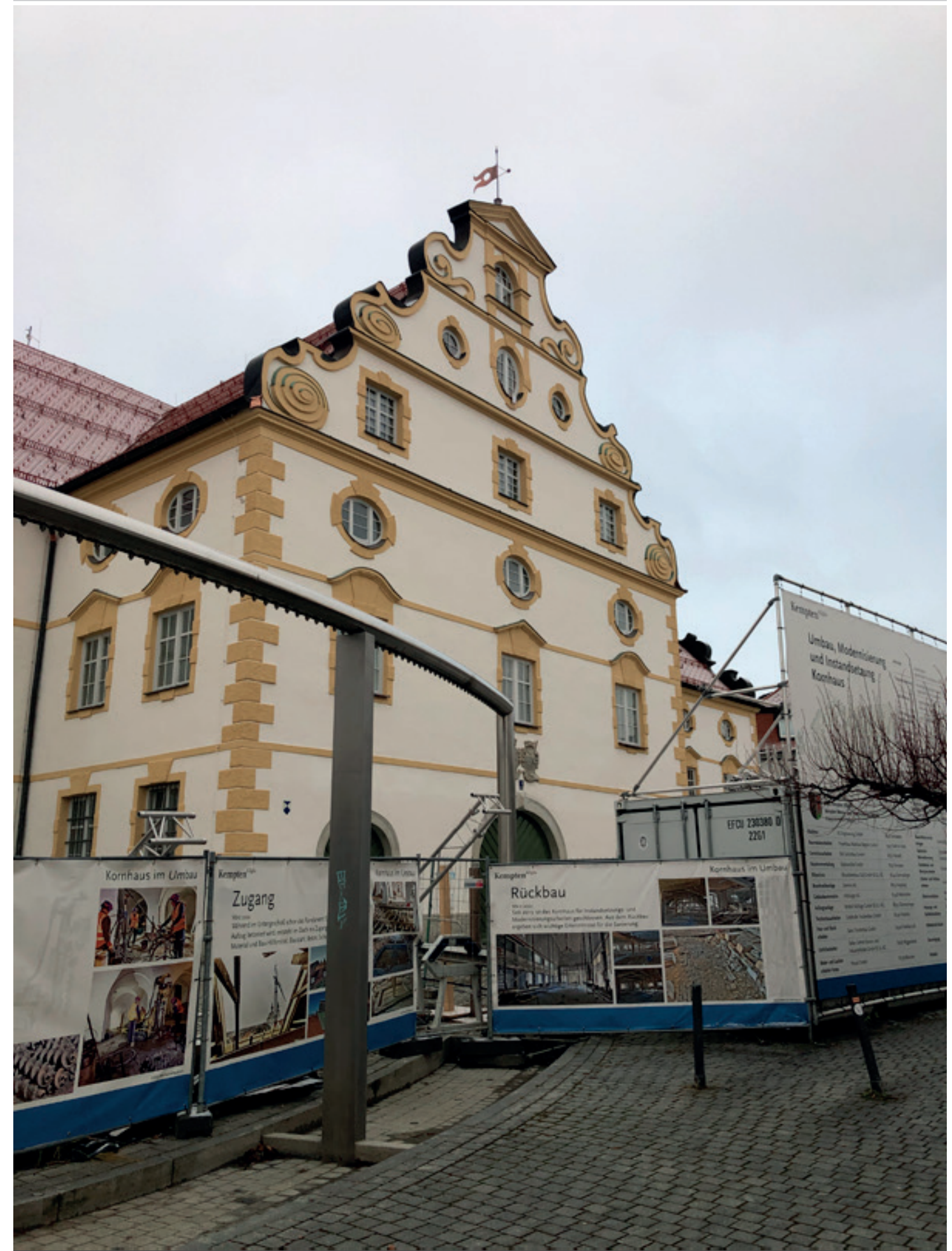
5. Ansicht Ost