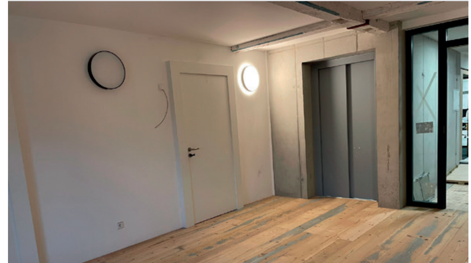
3. Treppenhaus Nord