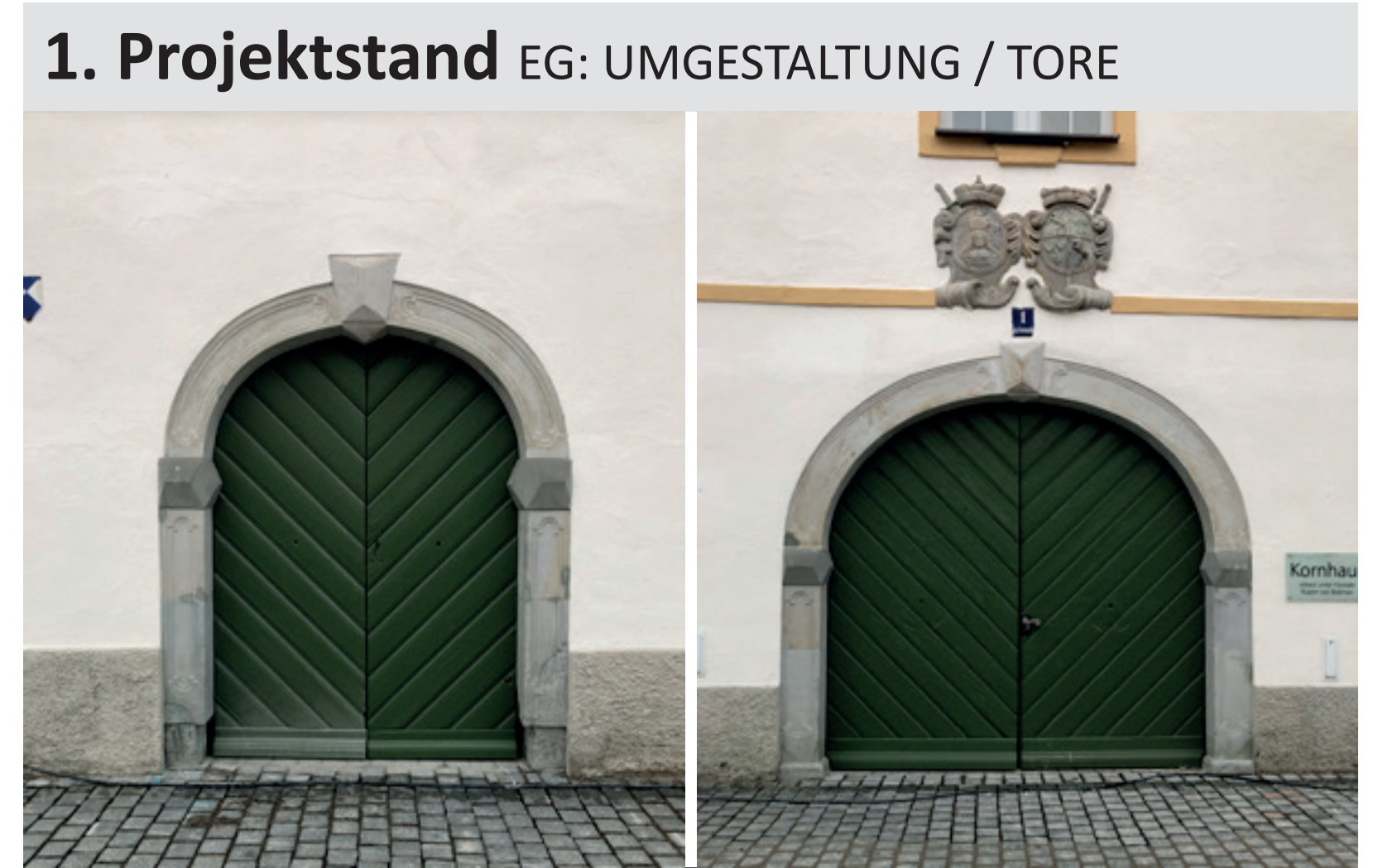
1. Projektstand EG: UMGESTALTUNG / TORE