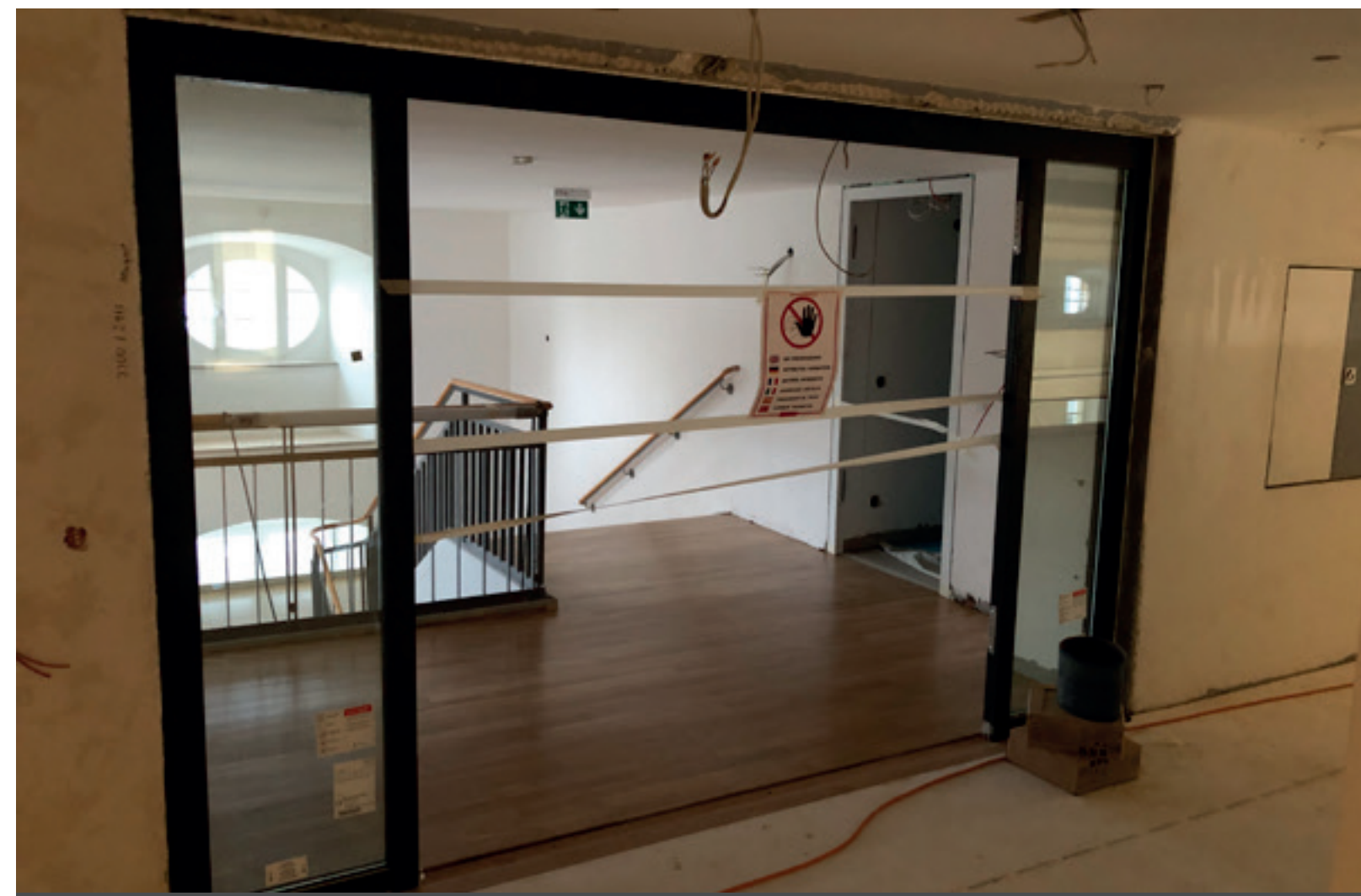
4. Treppenhaus Ost