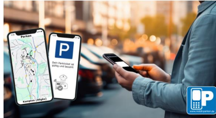
Stadt Kempten / Wirtschaft & Verkehr / Verkehr & Mobilität / Parken in Kempten / Handyparken