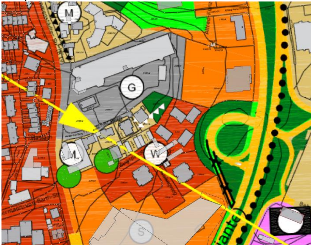
Abbildung 1: Ausschnitt Flächennutzungsplan