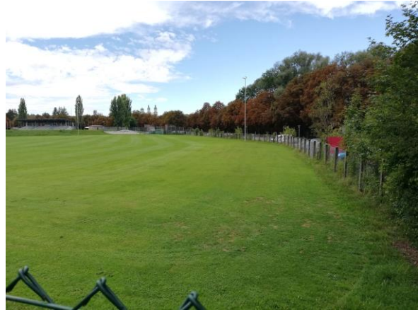
Blick von Osten über das Plangebiet. Im Hintergrund (von links) Illerstadion, Skatepark und Türme der Basilika St. Lorenz