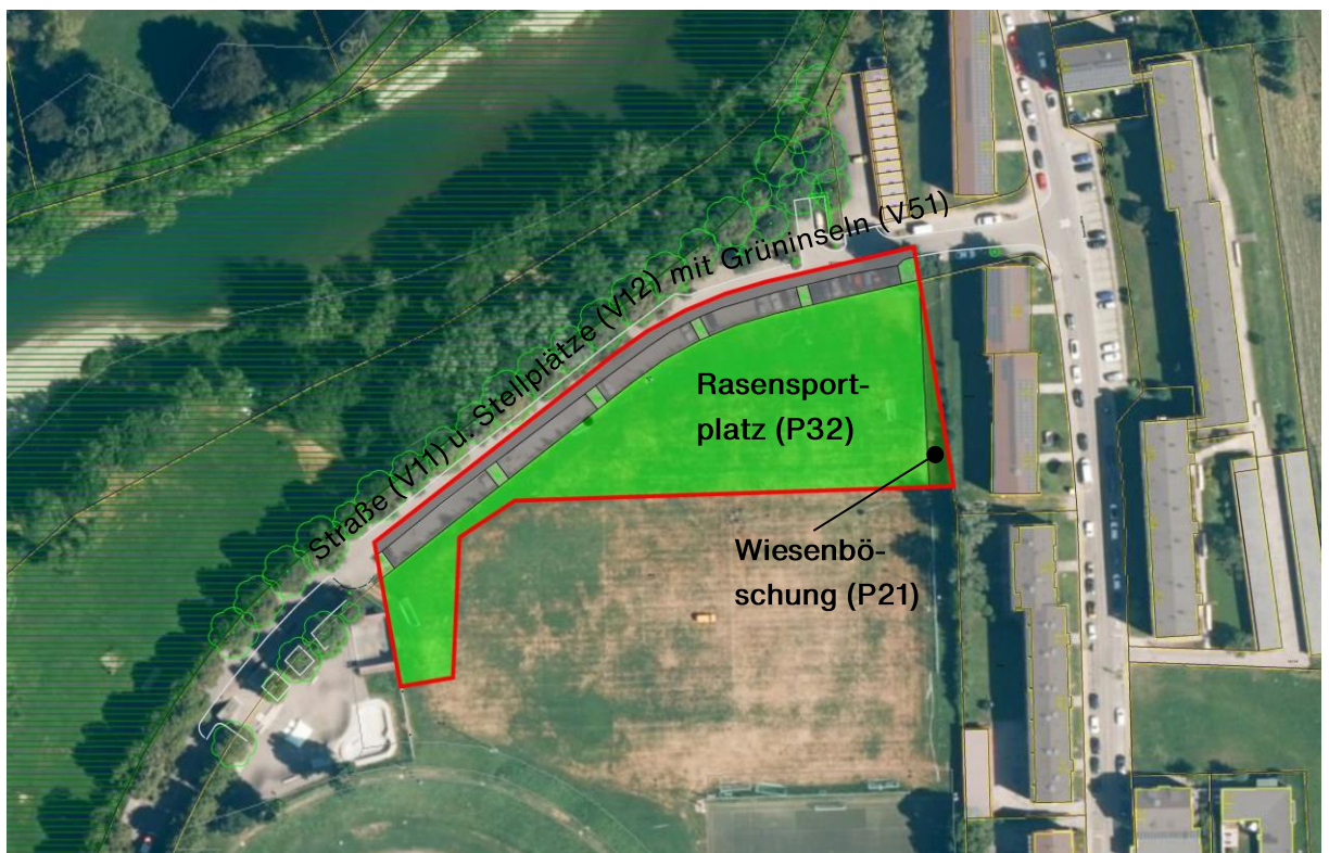
Abbildung 6: Übersicht über die bestehenden Biotop- und Nutzungstypen, o. M.