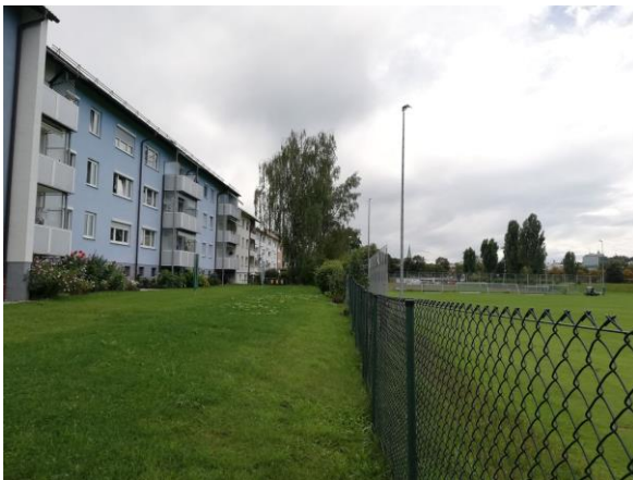
Blick von Norden entlang der östlichen Grenze des Plangebiets mit der hier angrenzenden Wohnbebauung