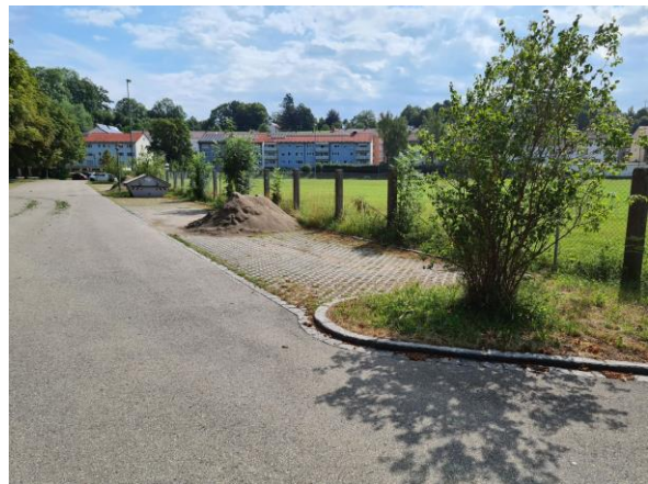
Blick von West nach Ost entlang der Straße Illerdamms mit den bestehenden Rasengitterstellplätzen im nördlichen Plangebiet