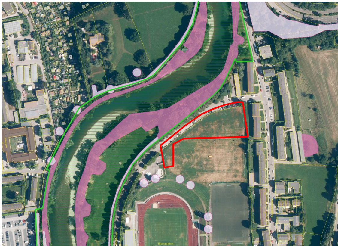
Abbildung 4: Luftbild mit Darstellung des Landschaftsschutzgebiets (grün umgrenzt) sowie der gesetzlich geschützten Biotope im Umfeld (pink: Flächenbiotope, rosa: Punktbiotope). Plangebiet rot, o. M.