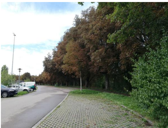
Blick nach Südwesten entlang des Illerdamms. Rechts im Bild die als Biotop geschützte Kastanien-Reihe