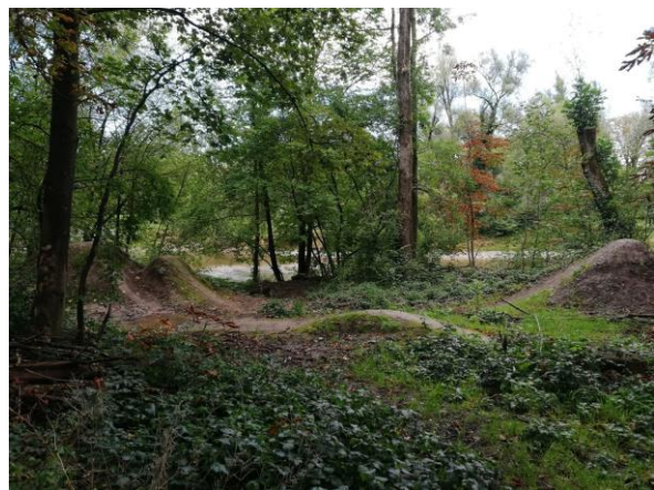
Blick in den westlich angrenzenden Auwald mit Dirtpark / Mountainbike-Trail. Im Hintergrund die Iller.