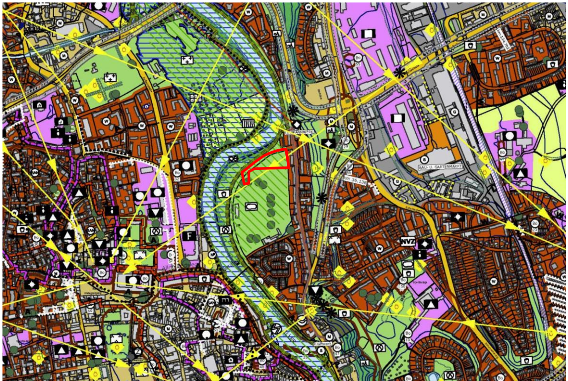
Abbildung 3: Ausschnitt aus dem rechtsgültigen Flächennutzungsplan mit integriertem Landschaftsplan der Stadt Kempten (Allgäu). Plangebiet rot, o. M.