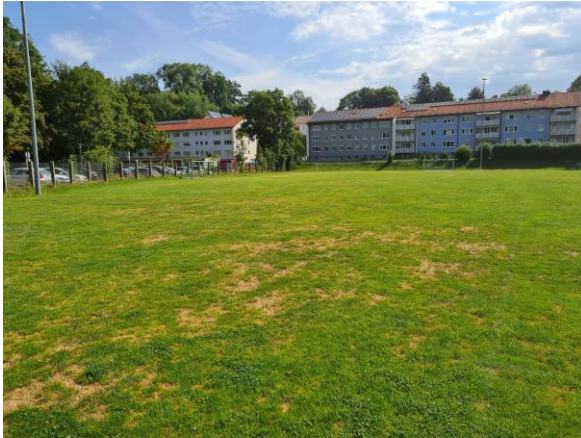
Blick von Westen über das Plangebiet. Monotone Sportrasenfläche (27.07.2022)