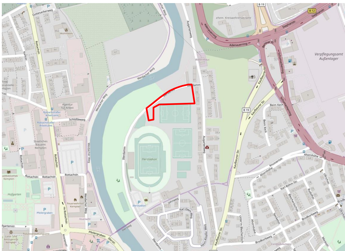
Abbildung 1: Ortskarte mit räumlichem Geltungsbereich (rot), o. M.

Das Plangebiet befindet sich im nördlichen Stadtgebiet von Kempten im Bereich der Sportanlagen rund um das Illerstadion und wird derzeit überwiegend als Sportrasen genutzt. Das eigentliche Illerstadion liegt ca. 50 m südlich; im Osten sowie Nordosten grenzt bestehende Wohnbebauung an. Im Norden und Westen wird das Plangebiet von dem asphaltierten Weg entlang des Illerdamms begrenzt. Jenseits davon verläuft die Iller mit schmalen Auwaldstreifen. In südliche Richtung setzt sich die Sportrasenfläche aus dem Plangebiet fort. Lage- und nutzungsbedingt sind die überplanten Flächen sehr eben.