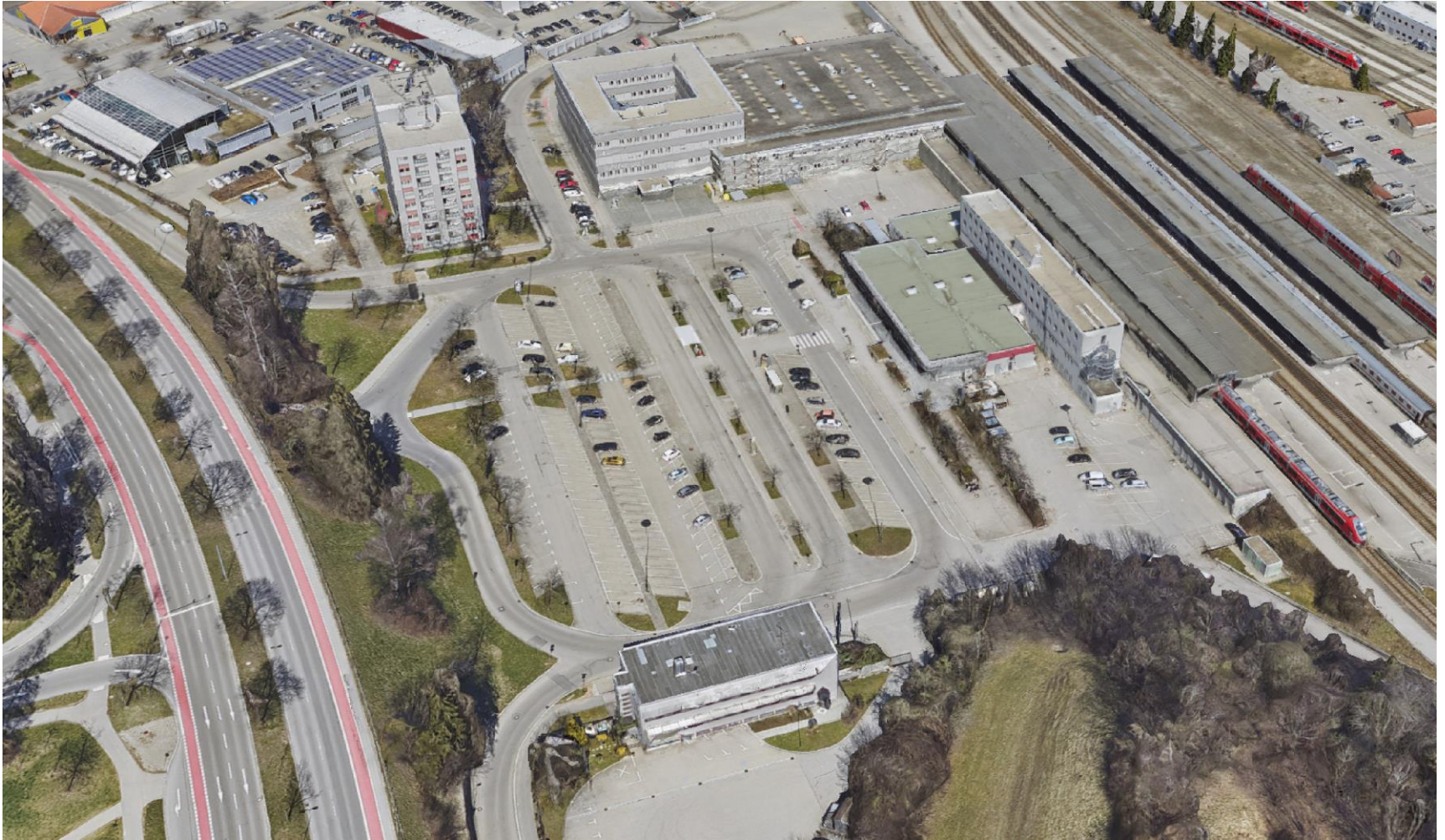
Südhub (SH) - Hauptbahnhofsvorplatz