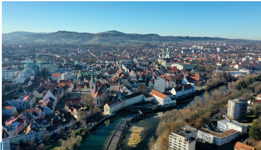
Strategie zur Anpassung an den Klimawandel in der Stadt Kempten (Allgäu)