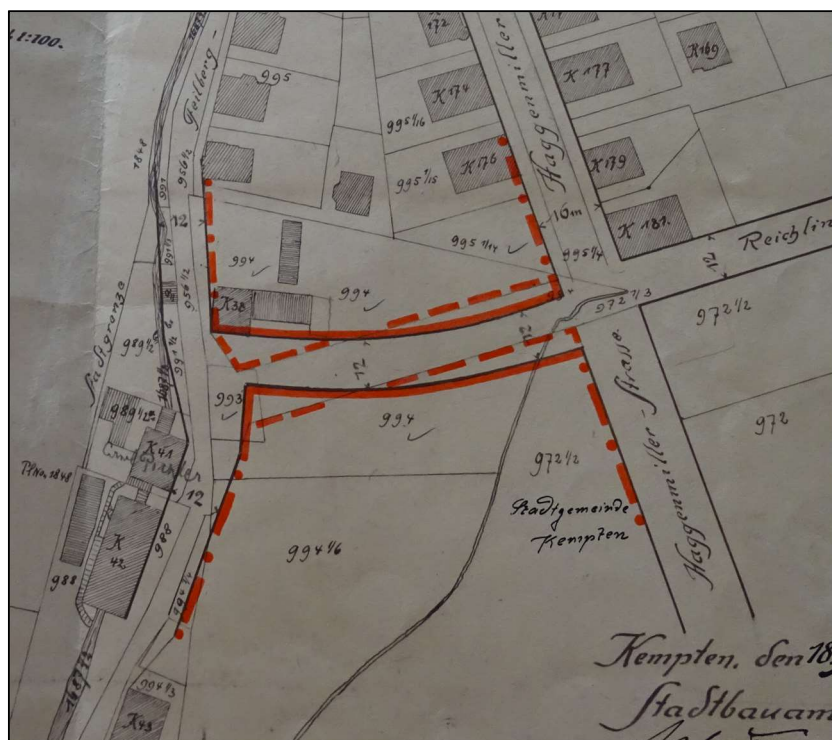
Abbildung der Grundfassung:

Die Baulinienänderung in der Reichlinstraße am Feilberg mit Rechtskraftdatum vom 14.12.1913 gibt eine kurvige Baulinie vor, sie bildet somit auch den Straßenraum der Reichlinstraße bis zur Anschlussstelle Feilbergstraße. Die heutige Straßenführung und Bebauung entspricht nicht diesem Plan. Am 07.02.1928 trat die erste Änderung des oberen Teiles der Reichlinstraße zwischen Feilberg- und Haggenmüllerstraße in Kraft. Festgesetzt sind jetzt Baulinien entlang des Straßenraumes. Aber auch diese Planung entspricht nicht mehr dem heutigen Bestand.