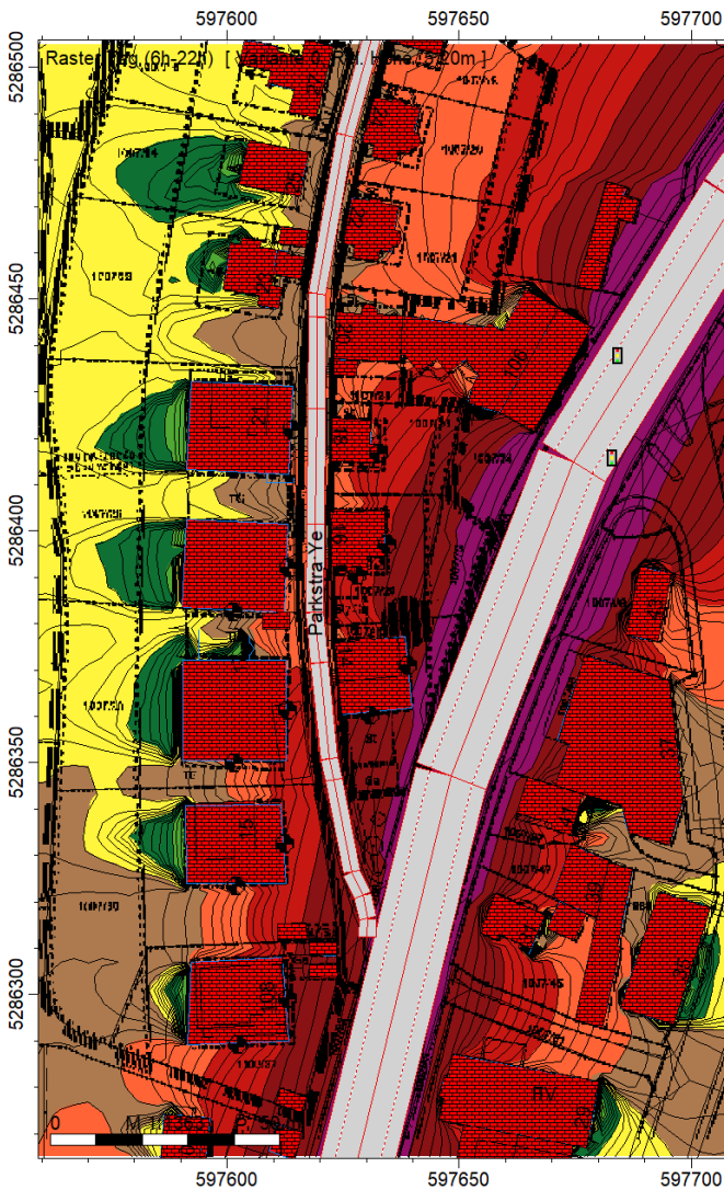
Raster tags (06:00 – 22:00 Uhr)