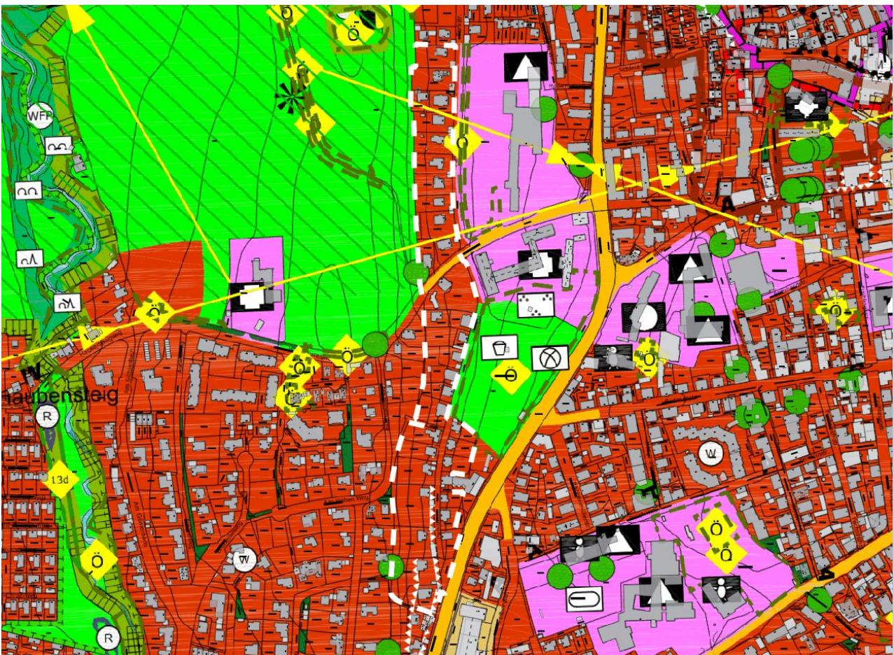
Abb. 1 Auszug FNP mit integriertem LP

Der derzeit gültige Flächennutzungsplan (FNP) aus dem Jahr 2009 weist für den Geltungsbereich Wohnbauflächen aus.