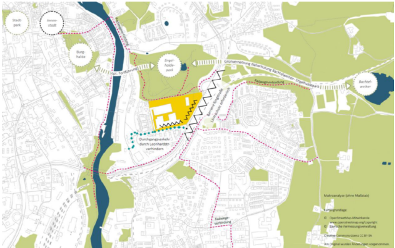
ABBILDUNG MAKRO-ANALYSE (Städtebauliche Untersuchung)